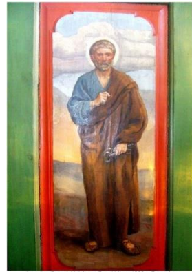
Apostlen Peter - Helsingør Domkirke - 1899 - Privat foto